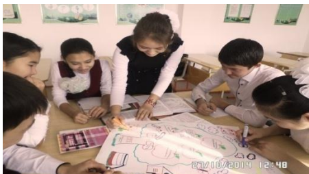
В. на уроке готовится к защите проекта