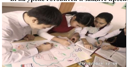
С. после изменений

После таких мнений я убедилась в том, что повысить навык общения у моих