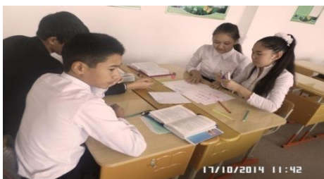
Ученица В. на уроке до изменений