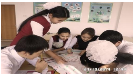
А. руководит работой группы