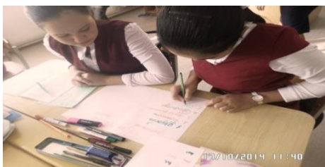
Ученица А. до изменений